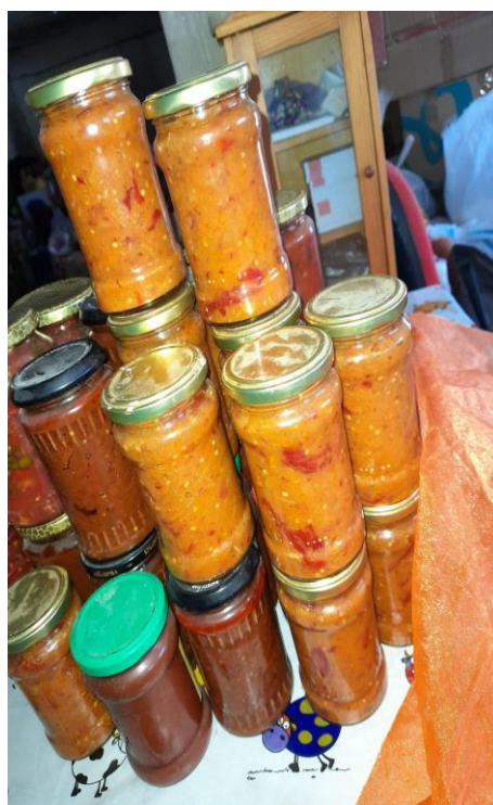
3.10. Campania „Dăruiește bucurie unui copil fără copilărie”