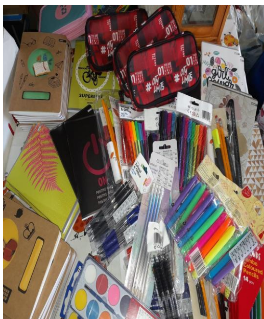
3.9. Campania „Cămara fermecată”