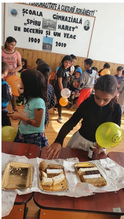
3.6. Campania „Fiecare fată contează”